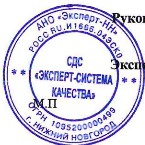
Схема сертификации 4

Протокола проверки результата услуг №23 от 20.07.2020г.