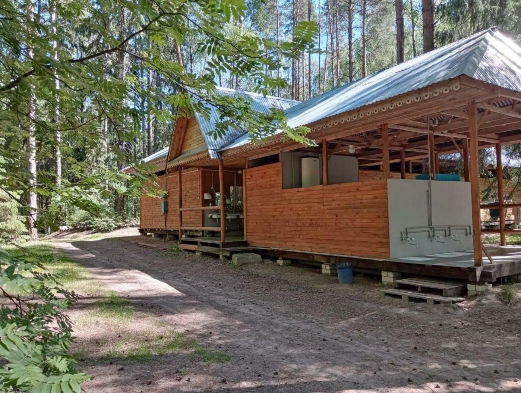
Умывальники, туалеты, души с горячей водой