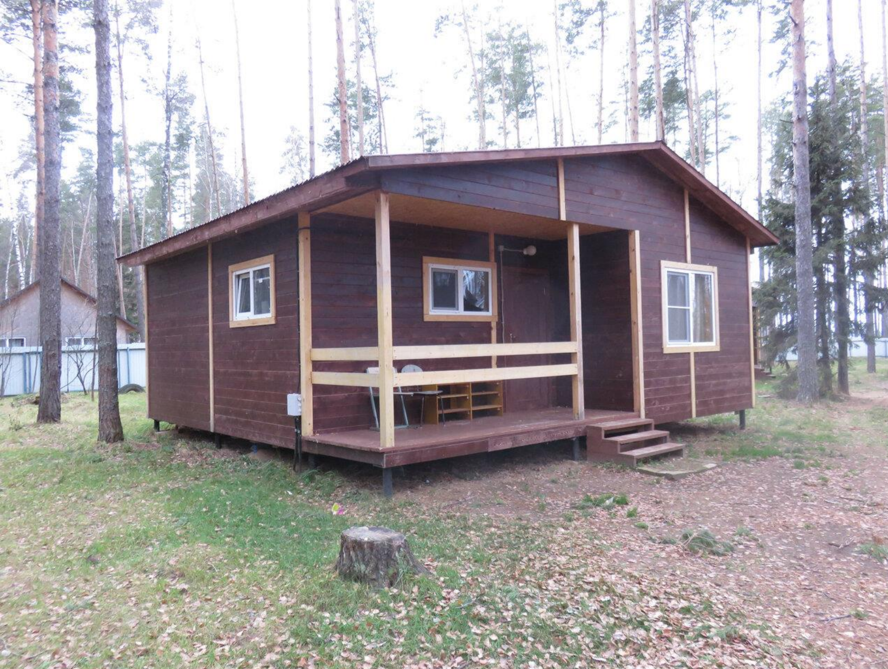
Домик с удобствами