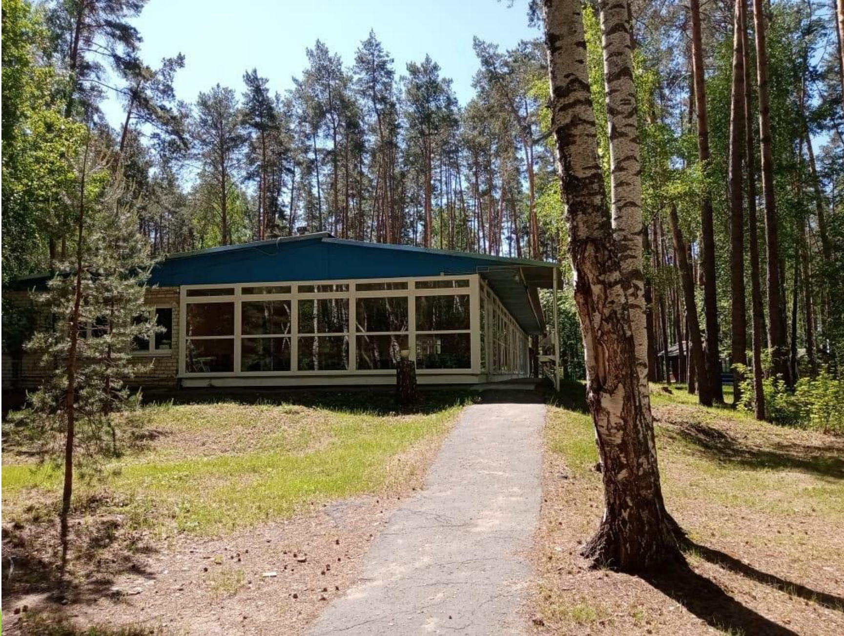
Столовая с четырех разовым питанием