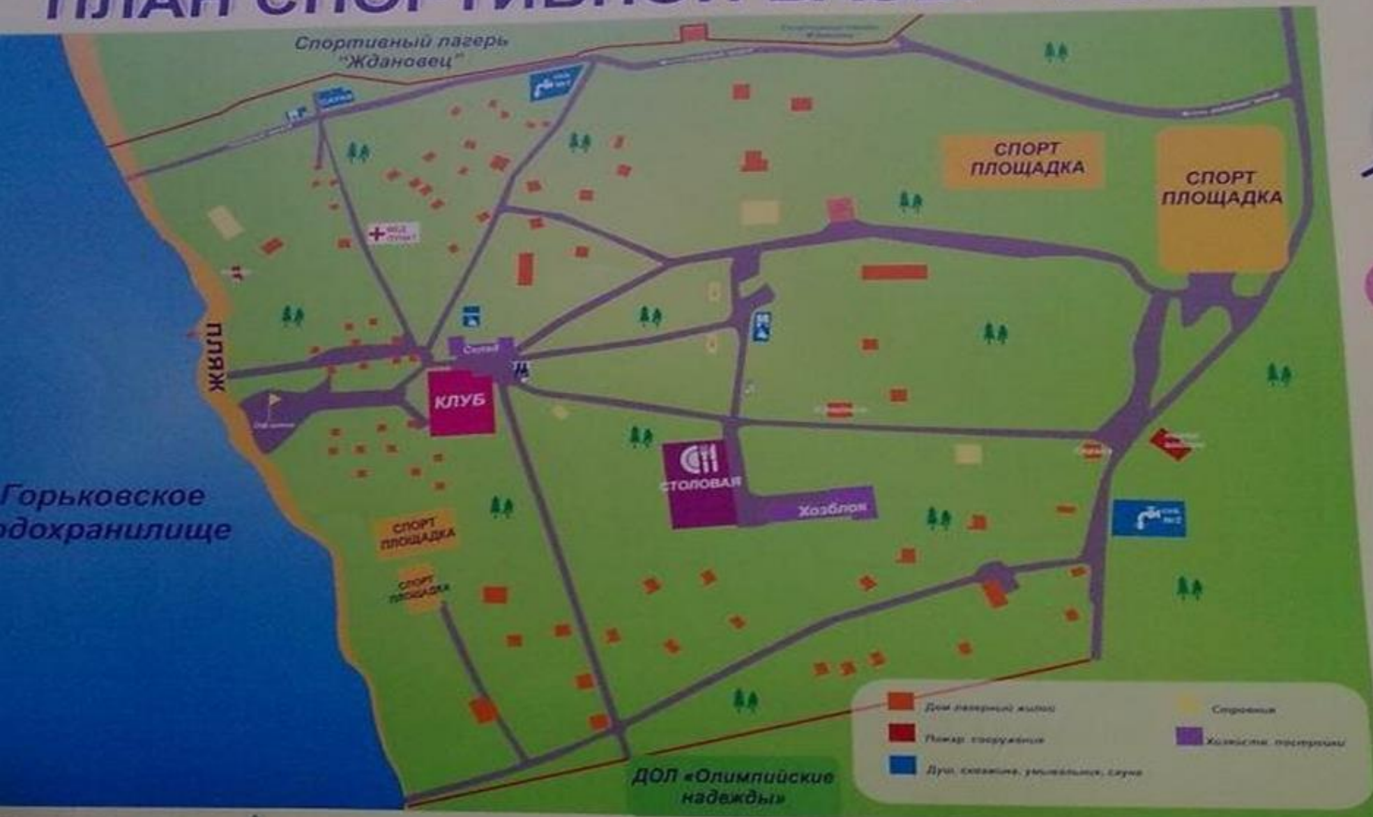
План спортивной базы «ФОРА»