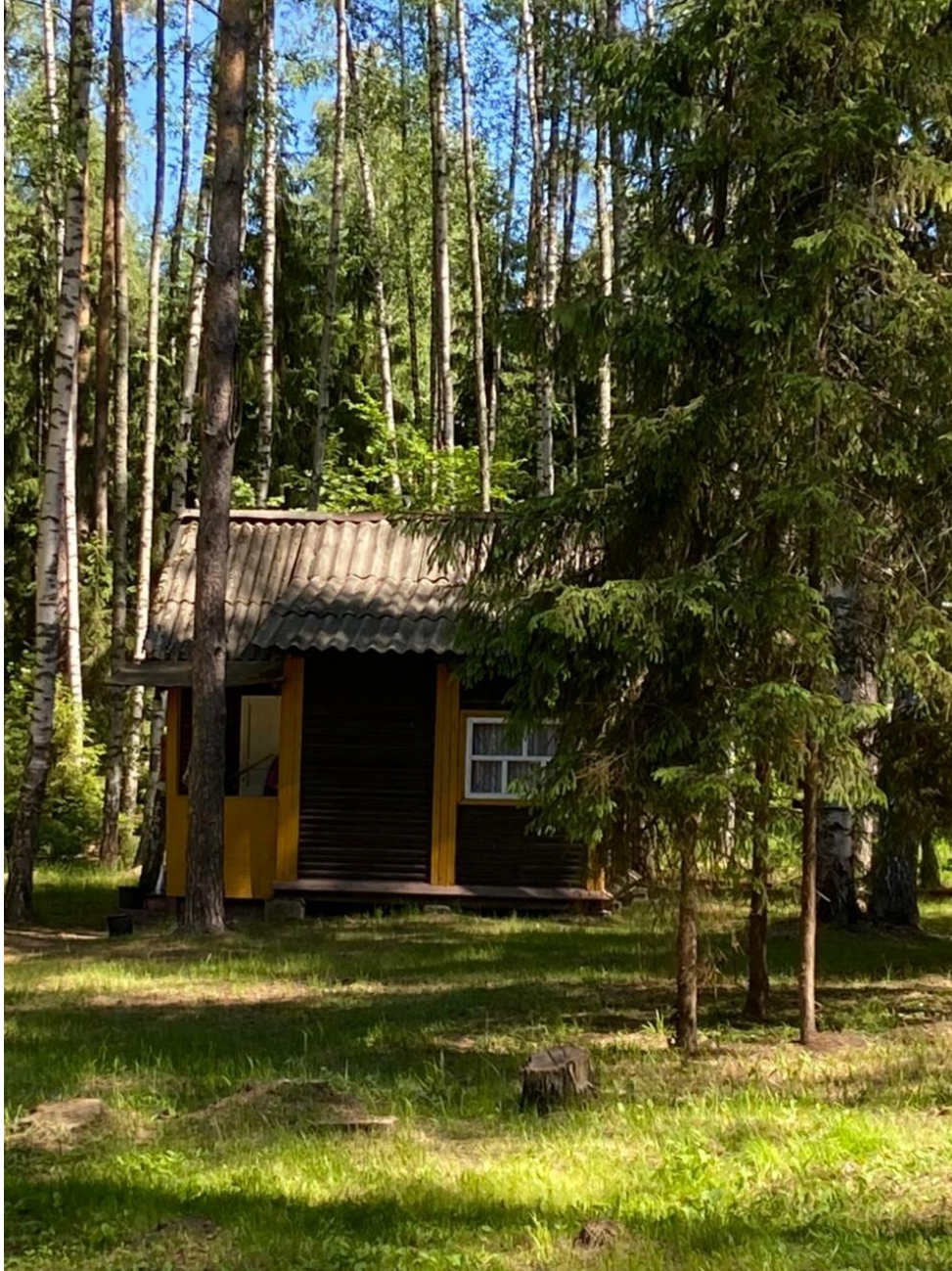
Домик без удобств