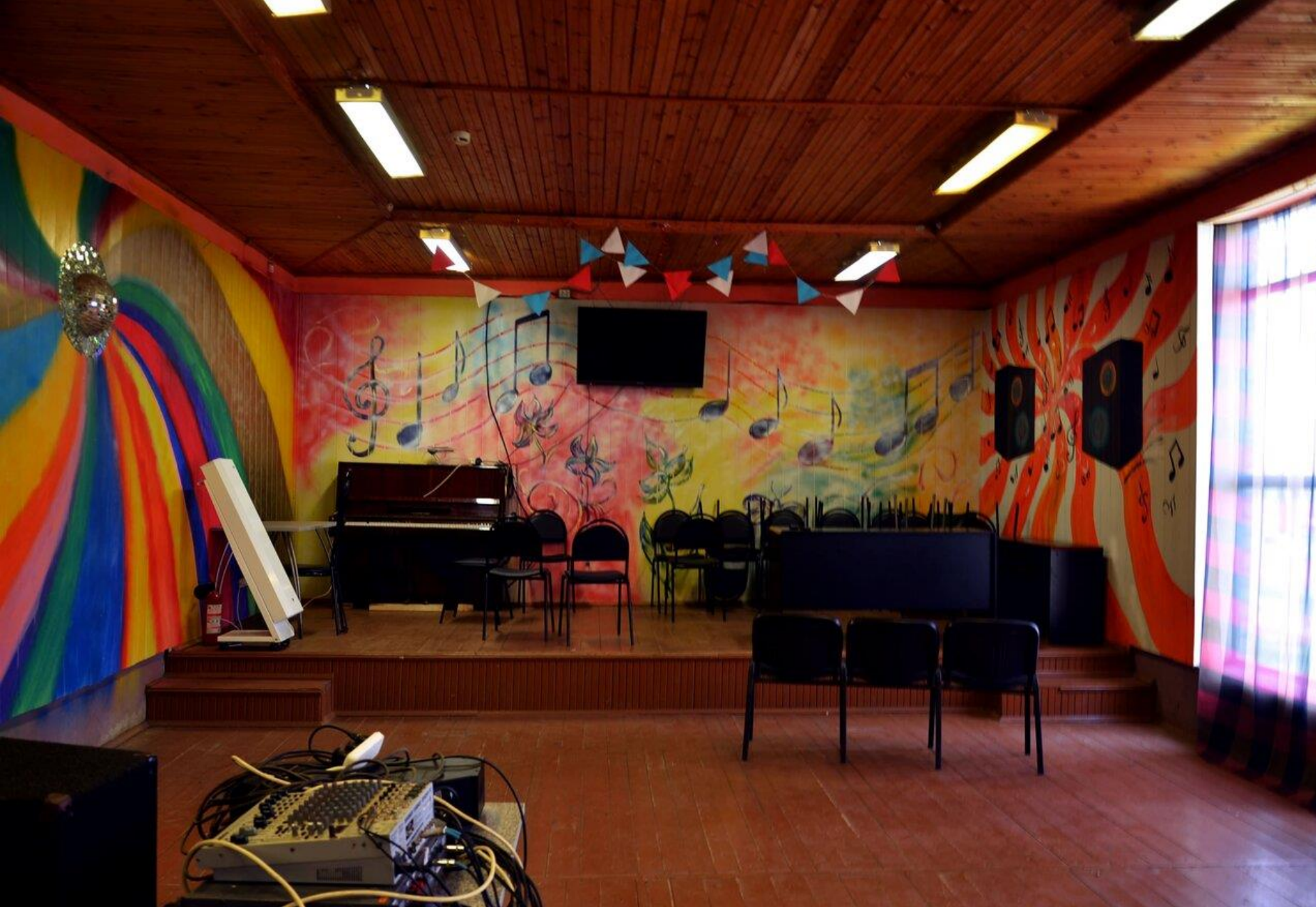
Клуб для культурно – массовых мероприятий