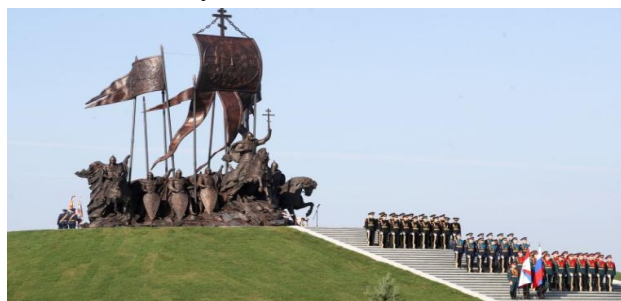
20-метровая бронзовая композиция весом 50 тонн состоит из конных фигур, князя, его брата, воеводы и шести витязей.

Наследием Александра Невского стало созданное потомками сильное, централизованное Российское государство, где народ осознал себя единым целым. А его подвиги были и остаются нравственной, духовной опорой, примером всепобеждающего патриотизма, заключил В.В.Путин. Суть подвигов Александра Невского отражена в словах Михаила Ломоносова, выбитых на гробнице князя: «Укротившему варварство на Востоке, низложившему зависть на Западе!» .