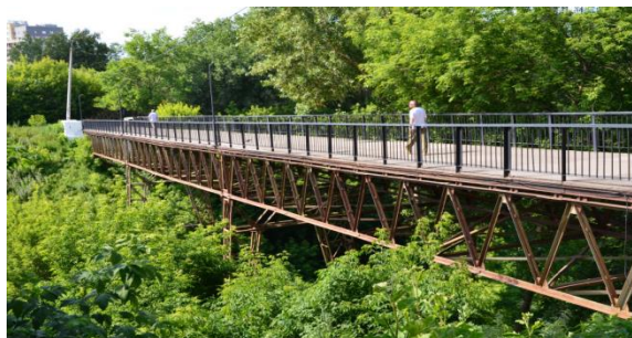
В районе Вознесенской церкви через Почаинский овраг перекинут пешеходный мостик, по нему можно пройти от улицы Ильинской до Большой Покровской.